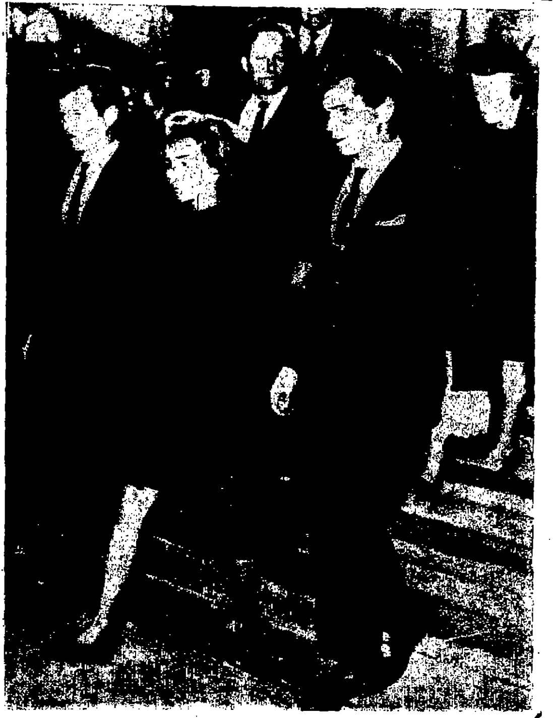
ملكة كيندي لدى خروجها من الكنيسة التي سجد فيها جثمان السناتور روبرت كيندي وتبدو زوجها ايليل تروست شقيقه انوار دوانه الكبر جوزيف بينما تظهر وراءهم والدة السناتور كيندي « مسورة ليويليا بيرس »